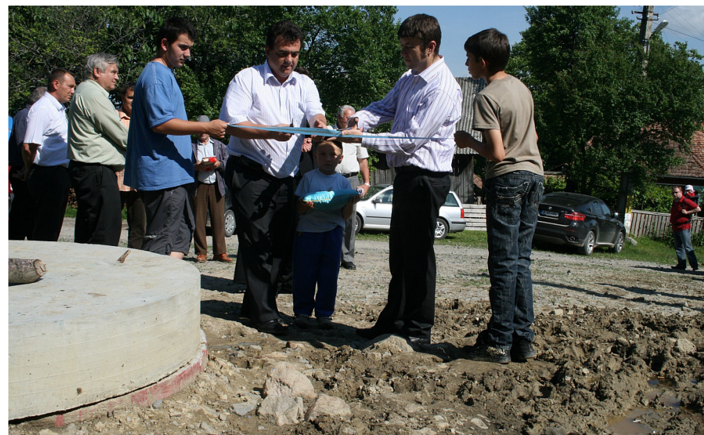
Az újonnan elkészült rendszer átadása

Talán az, hogy soha jobbkor nem épülhetett ez a rendszer, hiszen ma már világviszonylatban egyre több helyen okoz gondot a megfelelő minőségű ivóvíz hiánya. Ez a gond már nem fenyegeti a firtosmartonosiakat, illetve olcsón épült ki a rendszer, és nem utolsó pillanatban, mert azt mindenki tudja, hogy szorult helyzetben az ár is magas.