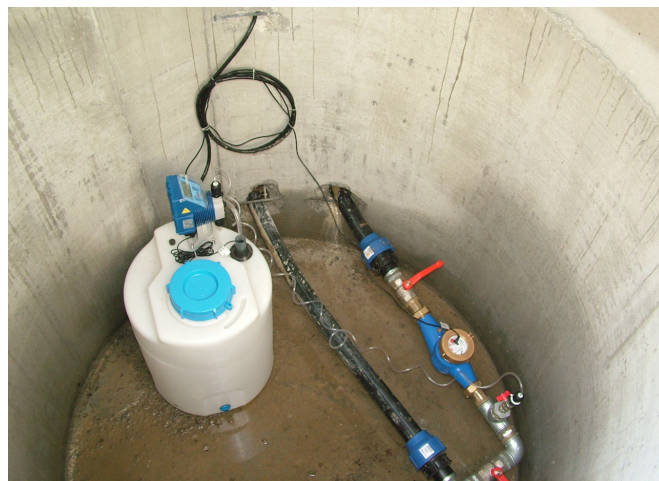
A firtosváraljai klórozórendszer