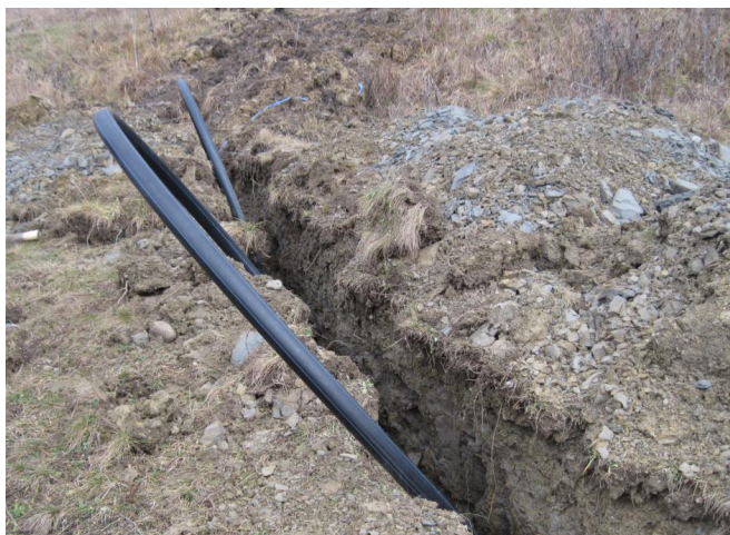
Vezeték lefektetés előtt