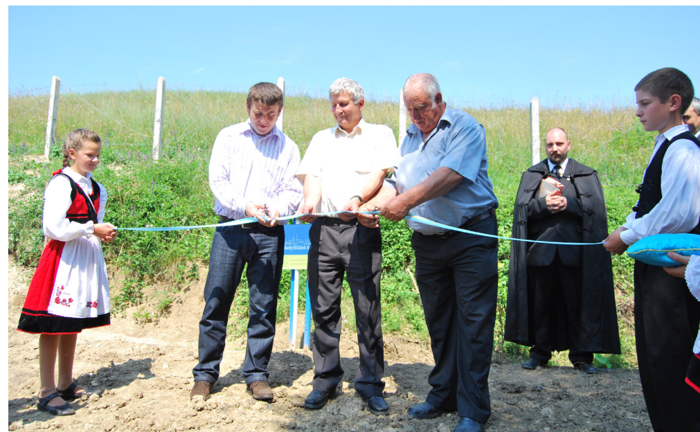
Az újonnan elkészült rendszer átadása

Soha jobbkor nem épülhetett ez a rendszer, hiszen ma már világviszonylatban egyre több helyen okoz gondot a megfelelő minőségű ivóvíz hiánya. Kénosnak számos lehetősége van a kitörésre, és a lakosok élnek is minden ilyen lehetőséggel. Jelen vannak a székelyudvarhelyi piacon gyümölcsstermekekkel, és a tejtermékek értékesítésére is törekednek a helyi gazdák, ehhez pedig a víz elengedhetetlen.