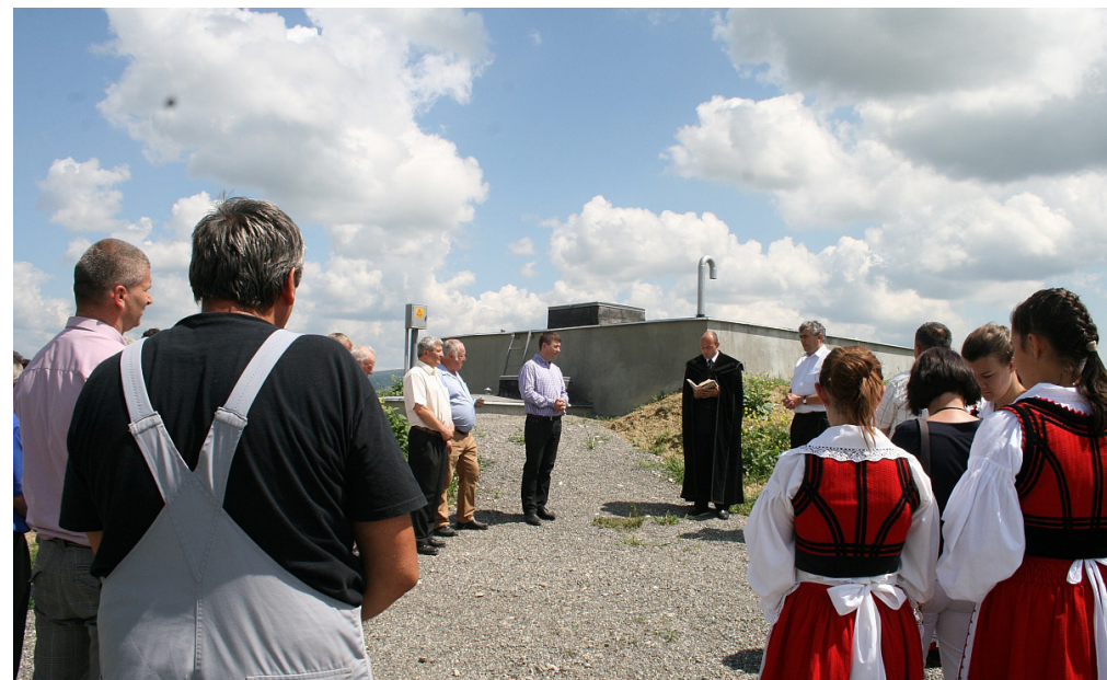
Az újonnan elkészült rendszer átadása

Az emberek kezdik megérteni, mi az alulról jövő kezdeményezés, és használják a érdekérvényesítési utakat. Városfalva esetében a lakosok az udvarhelyszéki RDMSZ révén utólag javasolták a projekt módosítását, amit a parlamenti képviselőlet közbenjárásával el is értünk. Soha jobbkor nem épülhetett ez a rendszer, hiszen világviszonylatban egyre több helyen okoz gondot a megfelelő minőségű ivóvíz hiánya. Ez a gond már nem fenyegeti a városfalviakat, illetve olcsón épült ki a rendszer, és nem utolsó pillanatban, mert azt mindenki tudja, hogy szorult helyzetben az ár is magas.