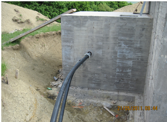
Így készült a 100 m 3 vasbeton tartály