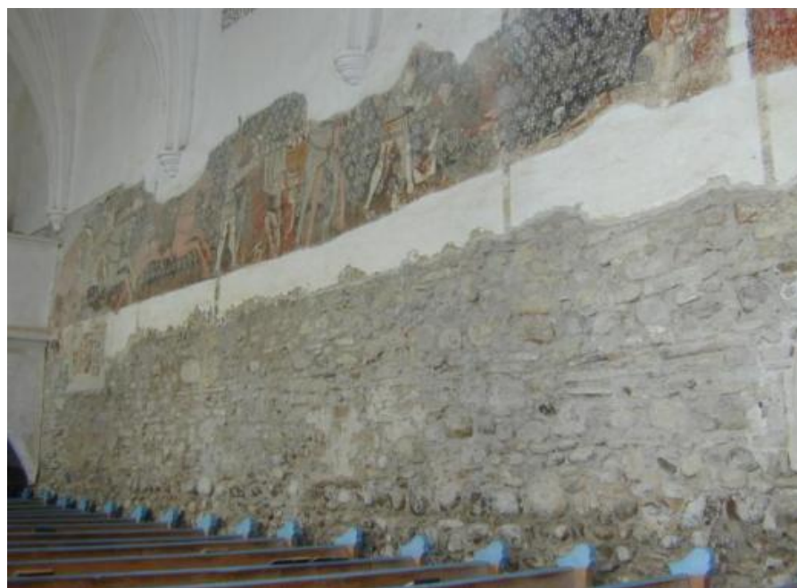
A székelyderzsi unitárius erődtemplom falképeinek restaurálása