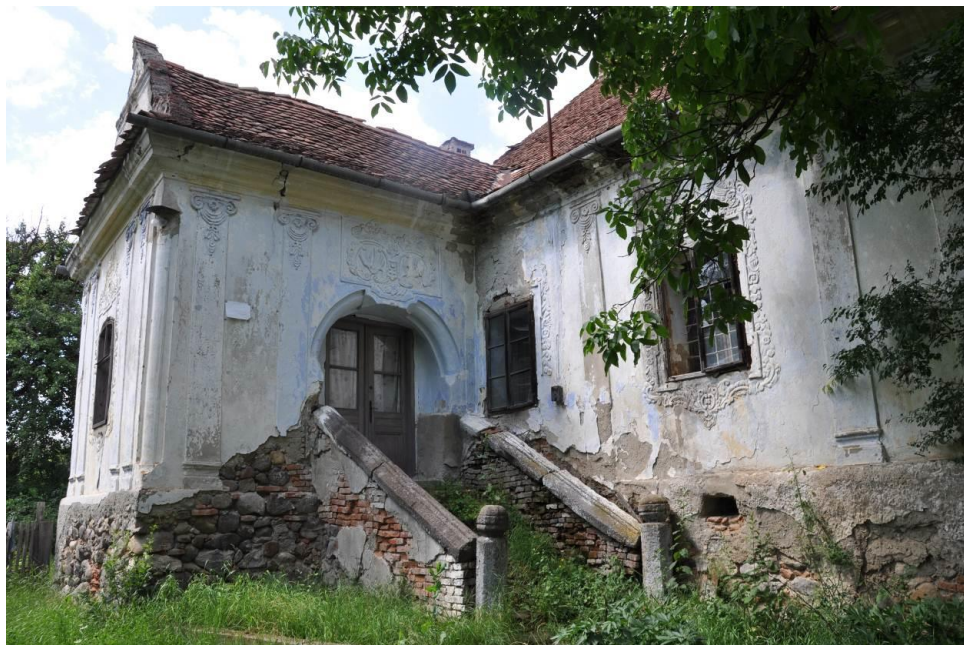
A homoródszentmártoni Ugron kúria felújítási tervének résztámogatása