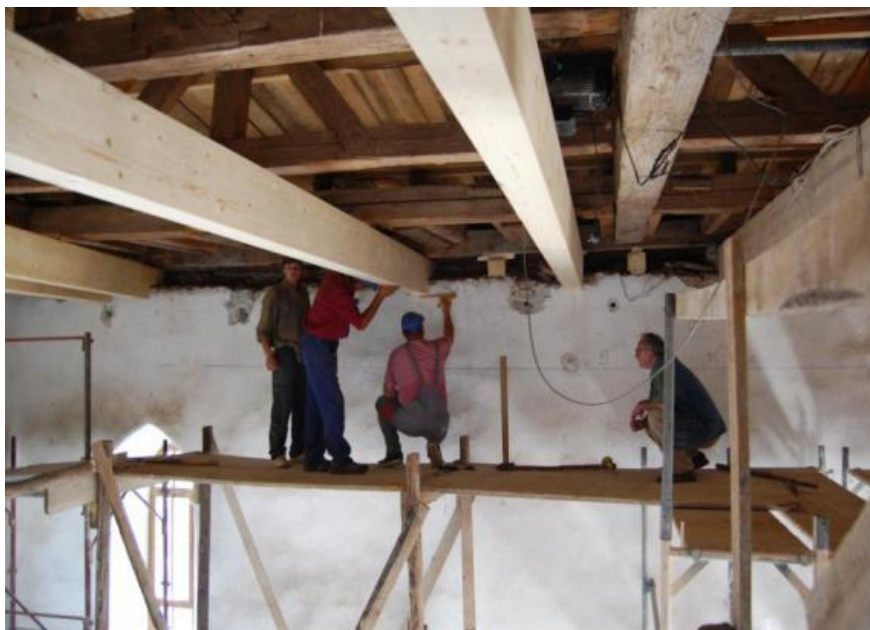
A csíkszelnei Szent János templom felújítási munkálatai