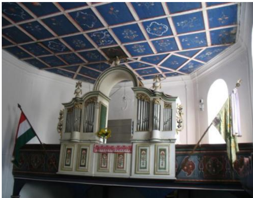
A szentábrahámi református templom orgonájának restaurálása