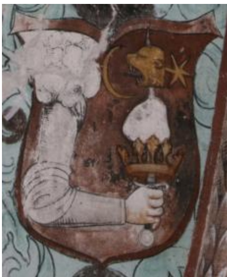
Székelydália: freskórészlet, egyesített régi és új székely címer ?!, XV. század vége.