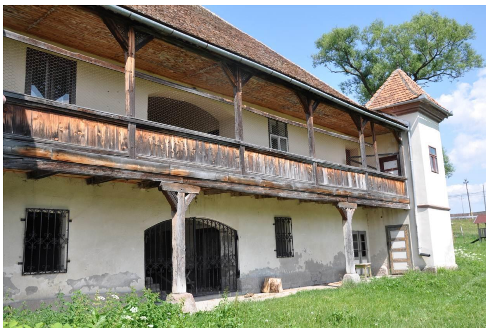
A csíkszeredai Endes kúria felújítási tervének résztámogatása