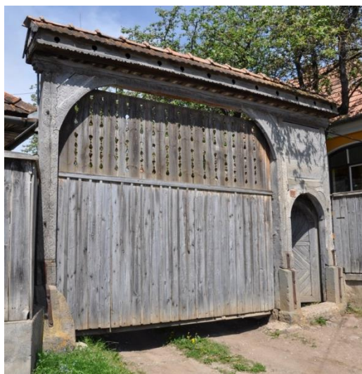
Poartă secuiască din Delnița (1909) Înainte de reabilitare / Csíkdelnei székelykapu (1909) Felújítás előtt