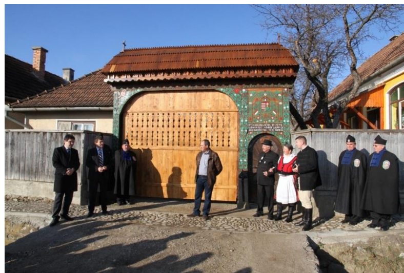
După reabilitare / Felújítás után