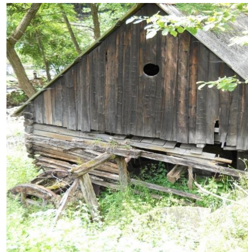
Restaurare piuă Sat Lueta/ Lövétébányai gypjú ványoló