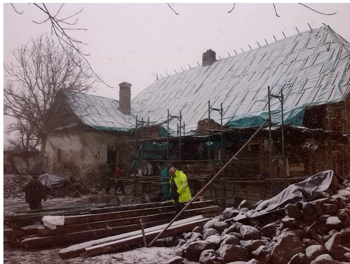
Intervenții de urgență la conacul Ugron / Sürgősségi beavatkozás az ugron kúriánál

În anul 2015 Consiliul Județean Harghita a cofinanțat protejarea monumentelor participante în program cu 300.000 de lei. Consiliul a cofinanțat realizarea proiectelor, intervențiilor de urgență, respectiv lucrări de reabilitare la 17 monumente din județ, aflate în proprietatea cultelor religioase sau a persoanelor fizice./ Harghita Megye Tanácsa 2015-ban 300.000 lejjel támogatta a programban résztvevő műemlékek felújítását, restaurálását. Idén 17, egyházi és magántulajdonban levő épület részesült résztámogatásban. Tervek elkészítése mellett sürgősségi beavatkozások, helyreállítási munkálatokat sikerült finanszírozni.